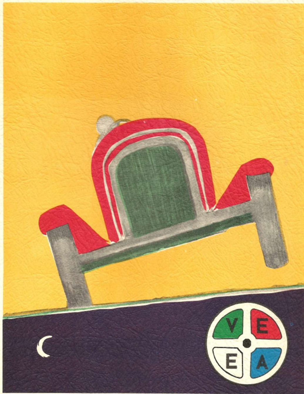
Leonetto Cappiello 1875-1942

EVEA b.p. 282, VMR, Montréal. VEAE p.o. box 282, TMR, Montreal.